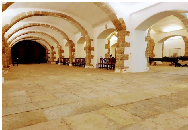
Vista das Caves Manuelinas / Sala de Exposições Hall d'exposition