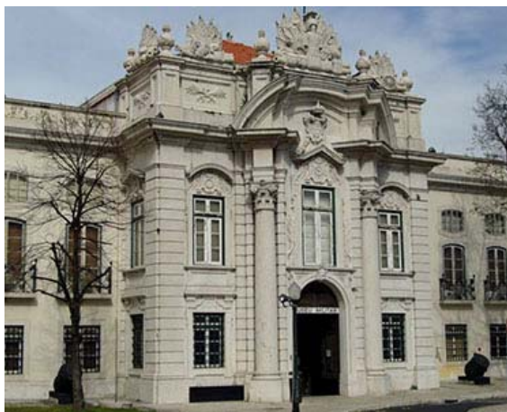
Vista Exterior do Museu Militar de Lisboa Exterior view of the Military Museum of Lisbon